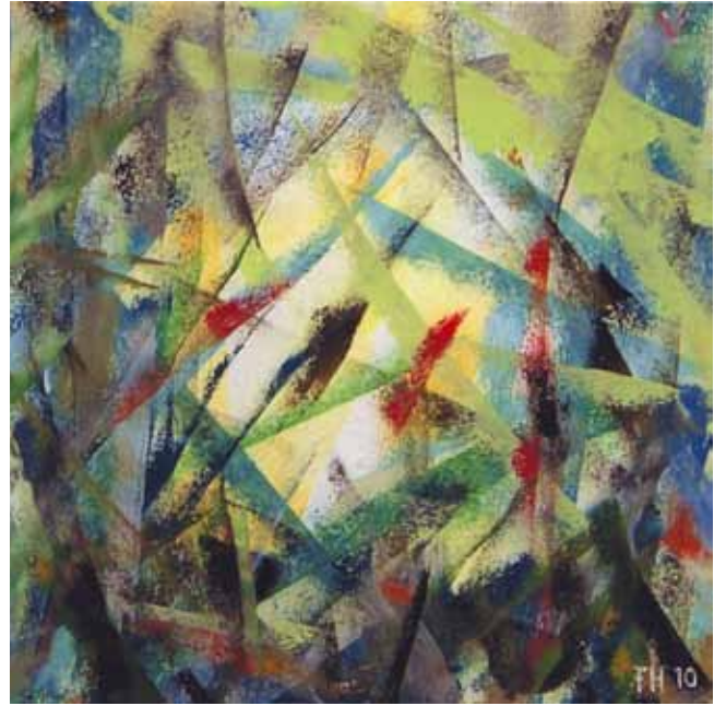
Ohne Titel, 2010

Auf Aufzeichnungen und Abbildungen der letzten 2 Jahre. Inspiriert von acht Jahrzenten. Ansehen, studieren, besichtigen, mustern, begaffen, betrachten. Und immer wieder aufmerken. Aus Respekt vor Farbe und Form des Lebens. Zum Wohl der Sinne.