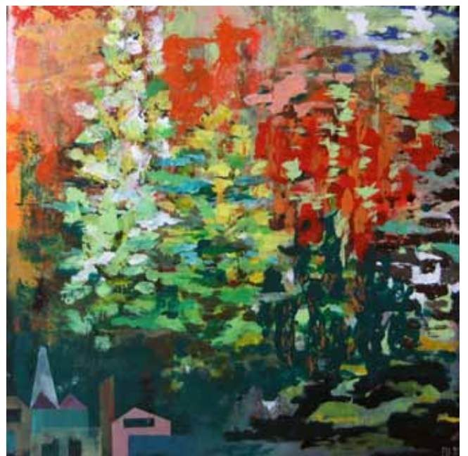
Im Garten, 2011